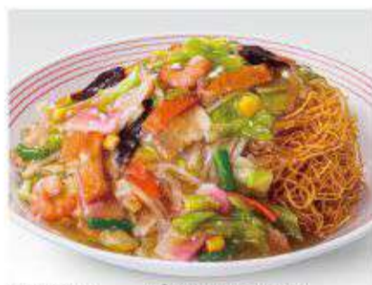
野菜たっぷり皿うどん 860円(税抜797円)