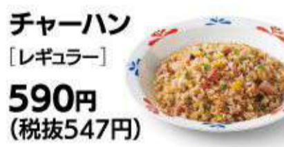
チャーハン [レギュラー] 590円 (税抜547円)