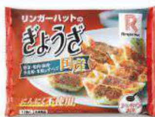
冷凍 ぎょうざ [12個入] 350円(税抜325円)