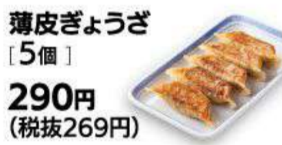
薄皮ぎょうざ [5個] 290円 (税抜269円)