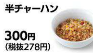
半チャーハン 300円 (税抜278円)