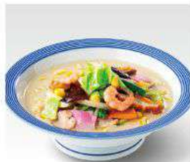
小さいちゃんぽん 520円(税抜482円)