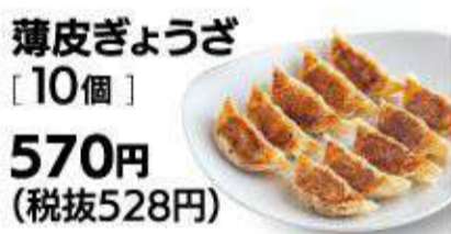
薄皮ぎょうざ [10個] 570円 (税抜528円)