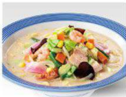
長崎ちゃんぽん 670円(税抜621円)