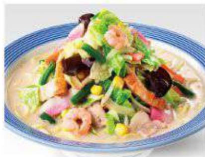
野菜たっぷりちゃんぽん 840円(税抜778円)