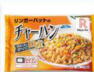
冷凍 チャーハン [400g] 450円(税抜417円)