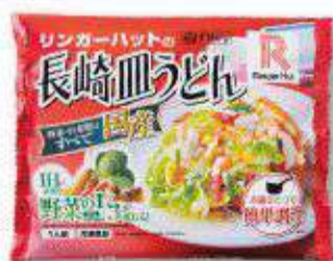
冷凍 長崎皿うどん 450円(税抜417円)