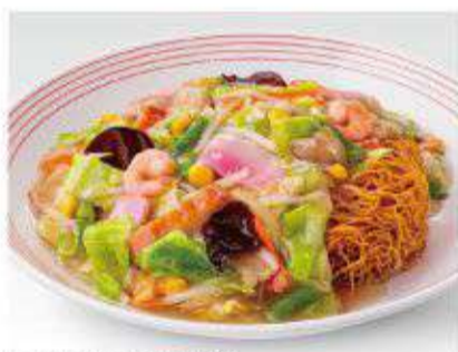
長崎皿うどん 700円(税抜649円)