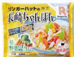
冷凍 長崎ちゃんぽん 450円(税抜417円)