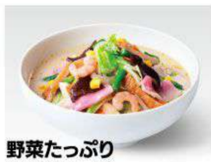
野菜たっぷり 食べるスープ 780円(税抜723円)