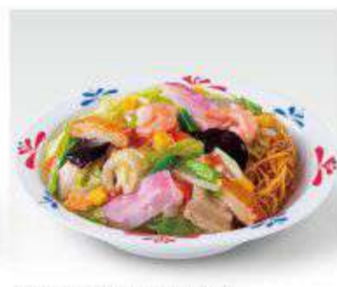
小さい皿うどん 520円(税抜482円)